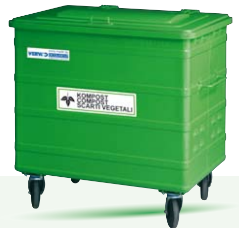
Kompost 800 Liter