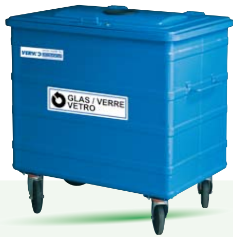
Glas 800 Liter