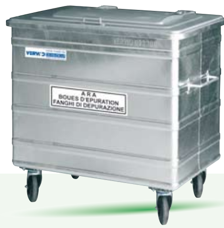
ARA 800 Liter