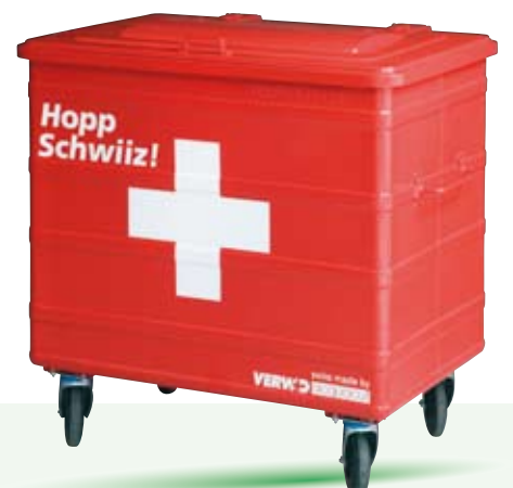
HOPP SCHWIIZ 800 Liter