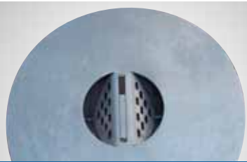
Aschenbecher (von oben)