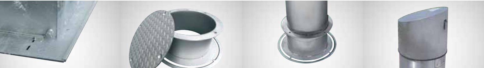
Auftriebsschutz bei Grundwasser